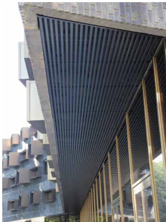
Student-Life, Brussel Het zwarte BL-H30-20 plafond met DuplexCoat geeft een hedendaagse uitstraling aan de luifels van Student-Life.

Met een metalen plafond kiest u voor een langetermijnoplossing. Een stalen LCC-plafond is bijzonder slijtvast en gaat gemakkelijk dertig jaar mee.