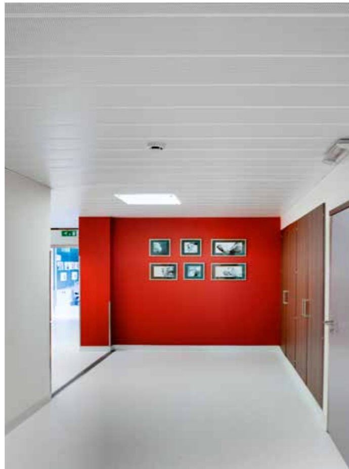
Plafond-XL, autoportant sur Bandrastrer Omega Grâce au système de suspension unique Omega Hook, vous pouvez prévoir un plafond-XL autoportant pour des locaux allant jusqu'à trois mètres de large. C'est pourquoi ce plafond acier LCC, stable au feu, est recommandé pour les couloirs.

L'application pratique est une chose; le visuel en plus, c'est mieux. LCC vous propose un choix étendu de largeurs de panneaux s'adaptant aux différents locaux. Vous pouvez même combiner différents panneaux d'une même gamme de produits; vous obtiendrez toujours un résultat homogène. En outre, nos plafonds sont simples à installer: un avantage certain dans des locaux ayant des formes irrégulières.